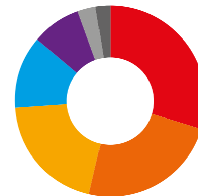
Utilisation des moyens d'exploitation