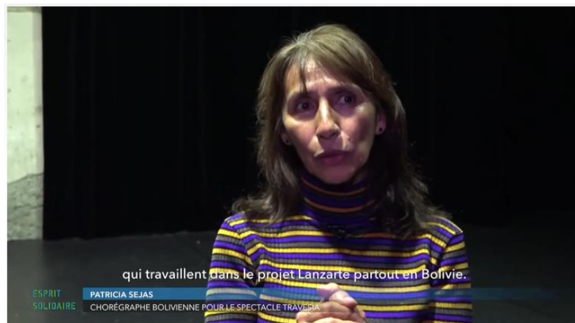
Emission Esprit Solidaire Léman Bleu 03.12.2019

qui travaillent dans le projet Lanzarte partout en Bolivie.