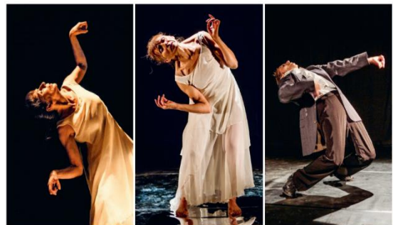
Magazine Solidarité novembre 2019