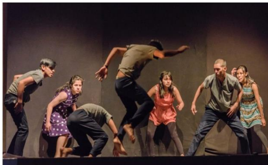
Travesía, une collaboration entre Danza, de Bolivie, et la compagnie genevoise Nô7a & Guero. Voix Artistes