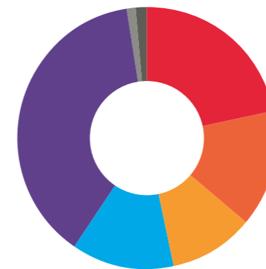
Herkunft der betrieblichen Mittel