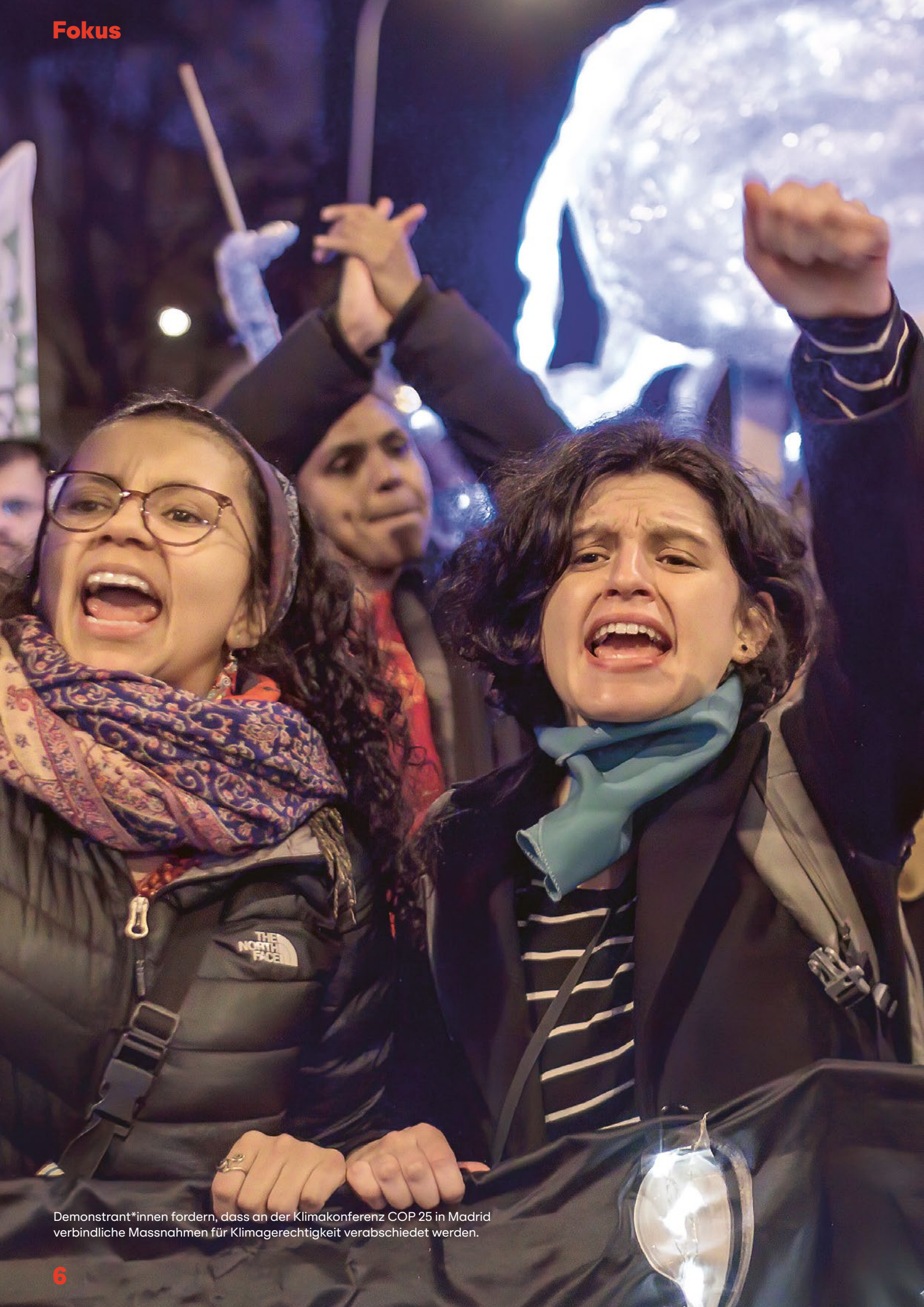
Demonstrant*innen fordern, dass an der Klimakonferenz COP 25 in Madrid verbindliche Massnahmen für Klimagerechtigkeit verabschiedet werden.