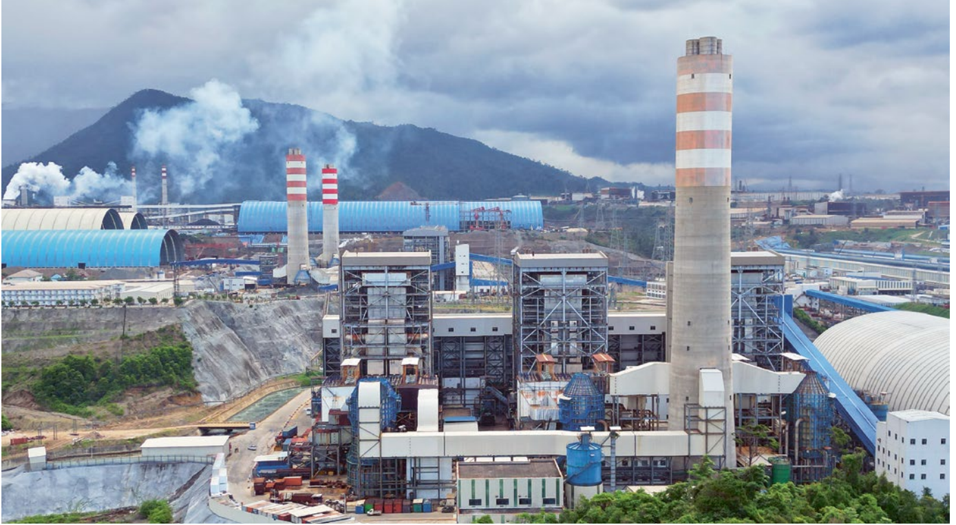
Im Industriepark Morowali in Indonesien werden die Arbeiter*innen ausgebeutet und die Luft verschmutzt.