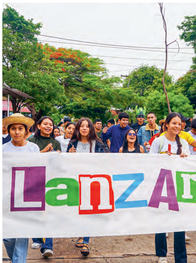
LanzArte-Jugendliche fordern einen verantwortungsvollen Umgang mit natürlichen Ressourcen im Amazonasgebiet.

Ich habe mich entschieden, bei LanzArte mitzumachen, weil ich etwas lernen und zur Zukunft meines Dorfs beitragen möchte. Nun verstehe ich, wie wichtig es ist, den Wald zu schützen, und fühle mich fähig, meine Ideen einzubringen. In fünf Jahren möchte ich studieren und mit meinem Einsatz für mein Dorf ein Vorbild für andere sein. Denn Urubichá ist ein wunderschöner Ort, der es verdient, dass wir gut mit ihm umgehen. Dank LanzArte können wir Jungen unsere Kultur, die Natur und die Teilhabe aller in unserer Gemeinschaft stärken. ●