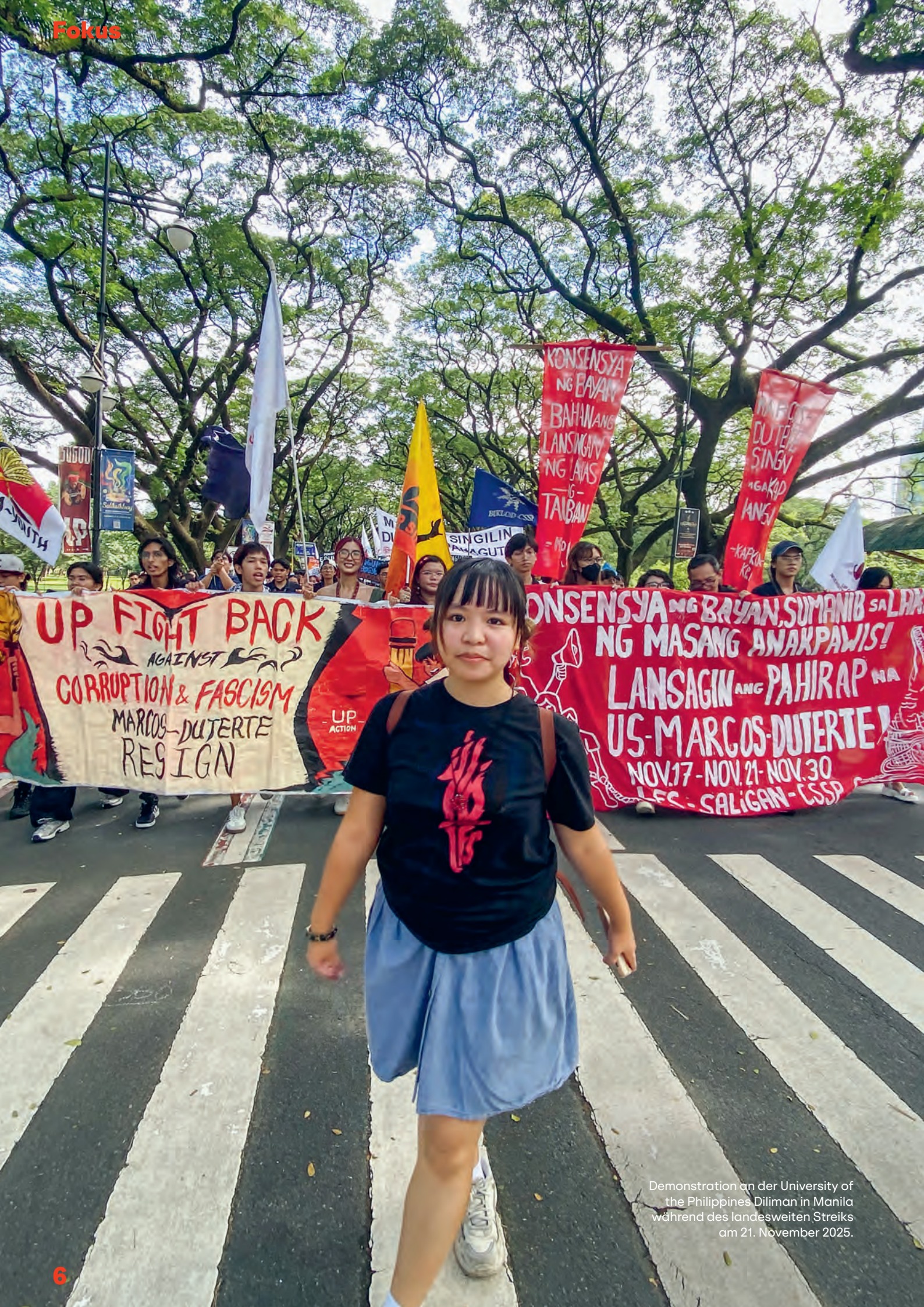
Demonstration an der University of the Philippines Diliman in Manila während des landesweiten Streiks am 21. November 2025.