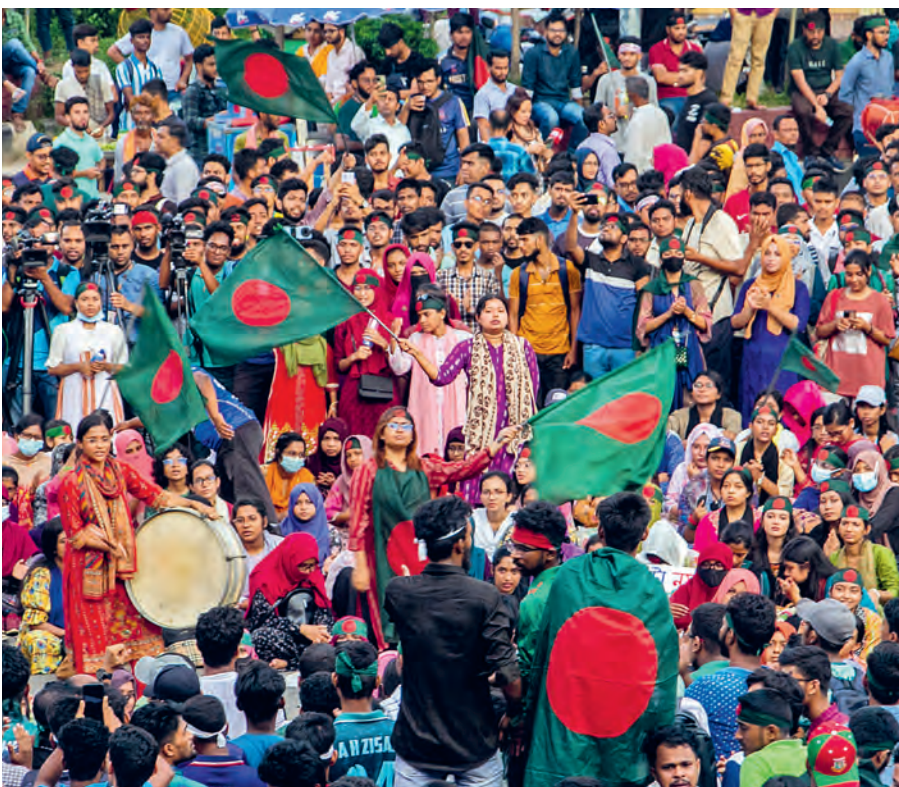
Studierende protestieren am 11. Juli 2024 mit der «Bangla-Blockade» gegen die Wiedereinführung des diskriminierenden Quotensystems im öffentlichen Dienst.

Vom 15. Juli bis zum 5. August wurden gemäss offiziellen Daten des Gesundheitsministeriums landesweit mindestens 631 Menschen getötet und rund 19'200 verletzt. Medien und Menschenrechtsgruppen gehen von noch