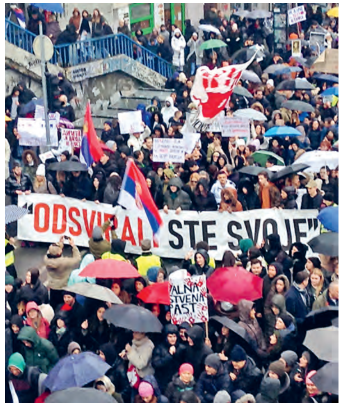
Am 24. Januar 2025 fordern Demonstrierende in den Strassen von Novi Sad mit dem Slogan «Du hast deine Melodie zu Ende gespielt» den Rücktritt von Präsident Vučić.

Genau dort setzt «Let's Debate Change» an: Sechs Debattierclubs in drei Gemeinden stärken die Mitbestimmung von Jugendlichen. Unter Anleitung lokaler Mentor*innen diskutieren Schüler*innen über selbstgewählte Themen, entwickeln Projektideen und lernen, Konzepte und Budgets auszuarbei-