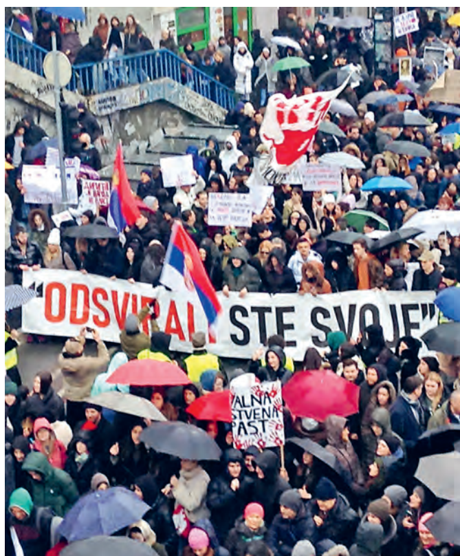
Le 24 janvier 2025, des manifestant-e-s réclament la démission du président Vučić dans les rues de Novi Sad sous le slogan « Ton temps est écoulé ».

C'est ici que « Let's Debate Change » entre en jeu. Six clubs de discussion basés dans trois communes renforcent la participation des jeunes. Sous la direction de mentors sur place, les élèves débattent de sujets de leur choix, développent des idées de projets et apprennent à préparer des concepts et des budgets. L'objectif est de les aider à adopter un esprit critique,