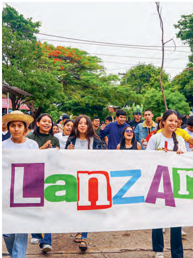
Les jeunes de LanzArte promeuvent une utilisation responsable des ressources naturelles dans la région amazonienne.

J'ai décidé de participer à LanzArte parce que j'ai envie d'apprendre et de contribuer à l'avenir de mon village. Je comprends maintenant à quel point il est important de protéger la forêt et je me sens capable de proposer mes idées. J'aimerais, dans cinq ans, suivre des études et être un exemple pour d'autres à travers mon engagement pour mon village. Urubichá est un endroit magnifique qui mérite que nous en prenions soin. Grâce à LanzArte, les jeunes peuvent renforcer leur culture, la nature et la participation de toute notre communauté. ●