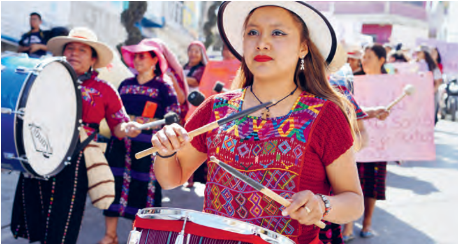
Des femmes manifestent contre la violence, le 8 mars à Huehuetenango, Guatemala

Elles ont peur de porter plainte parce que les juges donnent raison à leur compagnon violent. Il n'y a pas de justice pour les femmes », poursuit Esperanza Iquic.