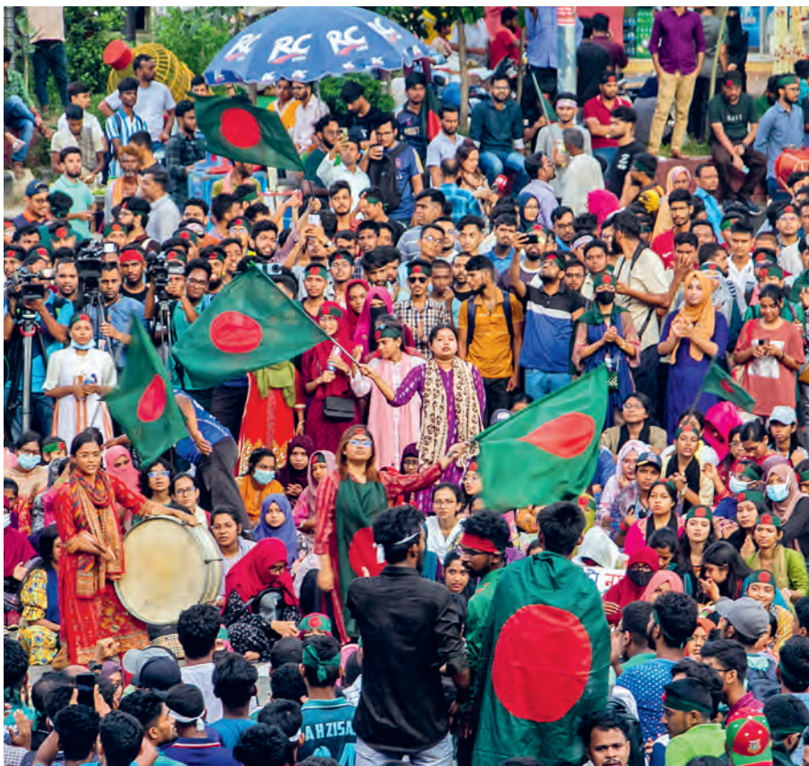
La Bangla-Blockade une manifestation étudiante du 11 juillet 2024 contre la réintroduction du système discriminatoire de quotas dans le service public.

Selon les données officielles du ministère de la Santé, au moins 631 personnes ont été tuées et environ 19 200 ont été blessées entre le 15 juillet et le 5 août. Les chiffres réels seraient encore plus élevés selon les médias et les groupes de défense des droits humains. Les forces de sécurité se sont servies de gaz lacrymogène, de matraques, de