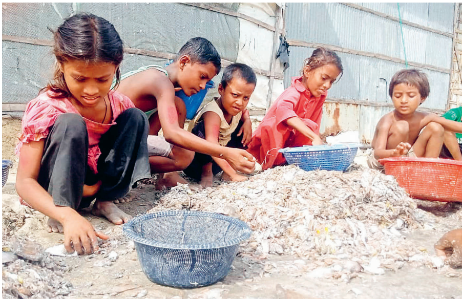
Des enfants au travail dans une usine de poisson séché à Cox's Bazar, au Bangladesh.