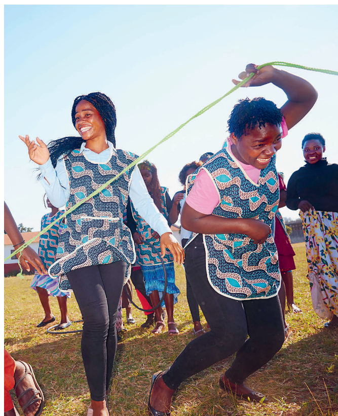
Des diplômées de l'institut de formation professionnelle Meu Futuro à Chimoio, au Mozambique, jouent pendant une pause.

Vous devez tenir compte de la part réservée à vos héritier·ère·s légaux·ales, qui a été modifiée lors de la dernière révision du droit successoral. Celle-ci a en effet réduit les parts réservataires, ce qui vous donne la liberté de décider d'une partie plus importante de votre succession. Les enfants ou,