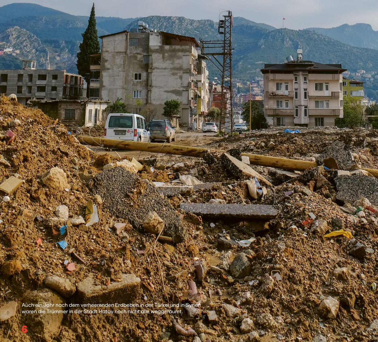
Auch ein Jahr nach dem verheerenden Erdbeben in der Türkei und in Syrien waren die Trümmer in der Stadt Hatay noch nicht alle weggeräumt.