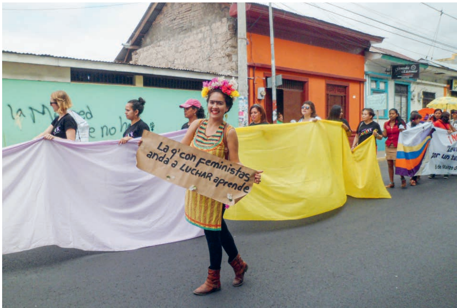
Frauendemonstration am 8. März 2015 in Nicaragua.

Mit dem Ziel, die Aktivitäten von NGOs zu erschweren oder gar zu verunmöglichen, werden Mitarbeitende, Gewerkschafter*innen, Aktivist*innen, Menschenrechtler*innen, aber auch Journalist*innen bedroht, verklagt und oft genug körperlich attackiert. Dies geschieht in einigen Ländern explizit gegen Frauengruppen, Migrant*innen oder sexuelle Minderheiten, oft unter Beschwörung