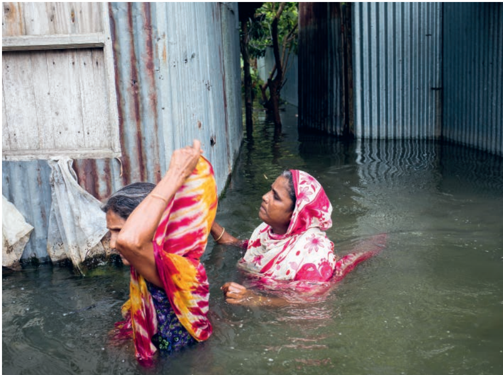
Zwei Frauen in Bangladesch waten durch Wasser, um ihre von der schweren Überschwemmung im Juni 2020 betroffenen Häuser zu verlassen.

ter*innen sind zu kurz- oder längerfristiger Migration gezwungen. Manche verlieren ihre Arbeit, oder ihr Zuhause wird wegen vergangener oder drohender Naturkatastrophen unbewohnbar. Allein in den Küstenstaaten Bangladeschs, Indiens, Pakistans und Sri Lankas waren laut Weltbank in der letzten Dekade über 700 Millionen Menschen – fast die Hälfte der Bevölkerung Südasiens – von mindestens einer klimabedingten Katastrophe betroffen.