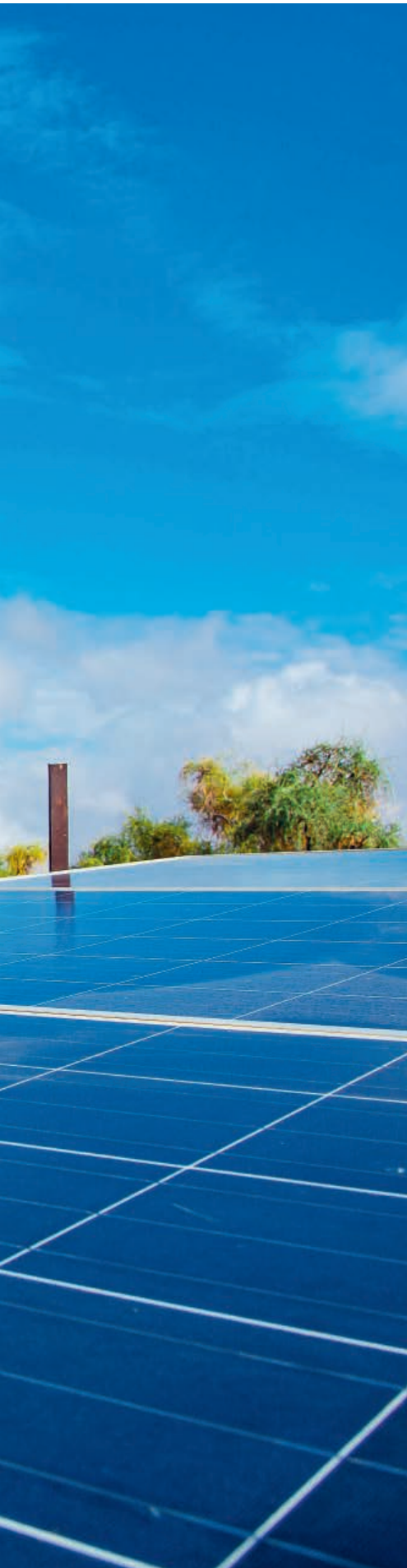
Angehörige einer mauretanischen Frauenkooperative beim Putzen eines Solarpanels. Dieses treibt ein Bohrloch an, das den Gemüseanbau mit Wasser versorgt.

Die drei grössten und sich gegenseitig verstärkenden Herausforderungen unserer Zeit – die wachsende Ungleichheit, die Klimakrise und die Einengung demokratischer Handlungsräume – können nur gemeinsamen angegangen werden: Es braucht einen ökologischen und sozial gerechten Wandel, eine Just Transition.