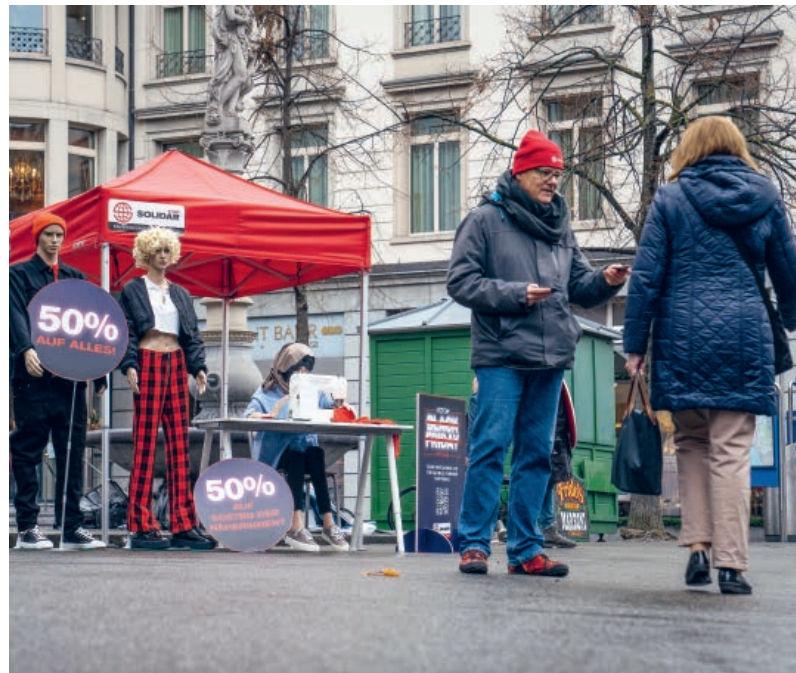
Am Zürcher Paradeplatz verteilten wir Flyer für die Abschaffung des Black Friday an die Passant*innen.