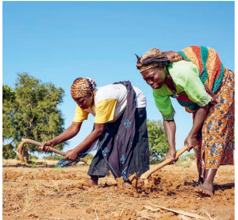
Bäuerinnen in Burkina Faso lockern ihre trockenen Felder auf.

Insbesondere Jugendliche und Frauen erhalten Beratung und Starthilfen, um auf ihren Höfen ein-