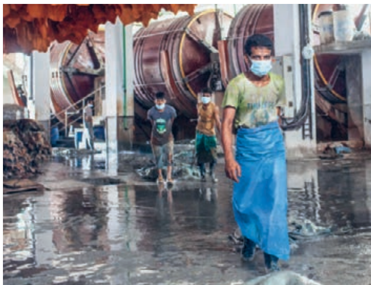
Gerbereiarbeiter in Bangladesch verdienen nicht einmal die Hälfte des Existenzlohns.

Leder ist das zweitwichtigste Exportprodukt von Bangladesch, das drei Prozent zur weltweiten Produktion beiträgt. Und die Regierung möchte die Exporteinnahmen steigern. Doch die Qualität wird durch die schlechten Arbeitsbedingungen beeinträchtigt. «Auch deshalb müssen Fabrikbetreibende