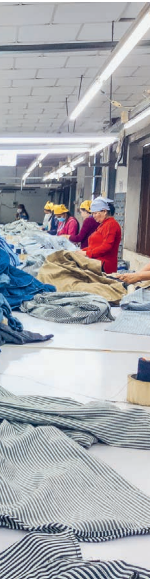
Eine Arbeiterin bei der Qualitätskontrolle in der Infong-Textilfabrik in Pnomh Penh.

Ein Existenz sichernder Lohn ist zentral für ein würdiges Leben – und er ist ein Menschenrecht. Trotzdem ist er in den Ländern des Globalen Südens für viele Menschen keine Realität. Welche Bedürfnisse müssen für eine menschenwürdige Existenz erfüllt sein? Wie wird der Living Wage berechnet? Und welche Bedeutung hat er für Labels, die garantieren, dass ein Produkt entlang der gesamten Lieferkette unter würdigen Arbeitsbedingungen hergestellt wurde?