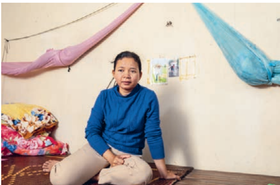
Eine Arbeiterin der Textilfabrik Hung Wah in ihrer Unterkunft in Pnomh Penh.

Inzwischen haben Gewerkschaften in der Region die Notwendigkeit eines kollektiven Ansatzes zur Sicherung von Existenz sichernden Löhnen erkannt: Dies führte