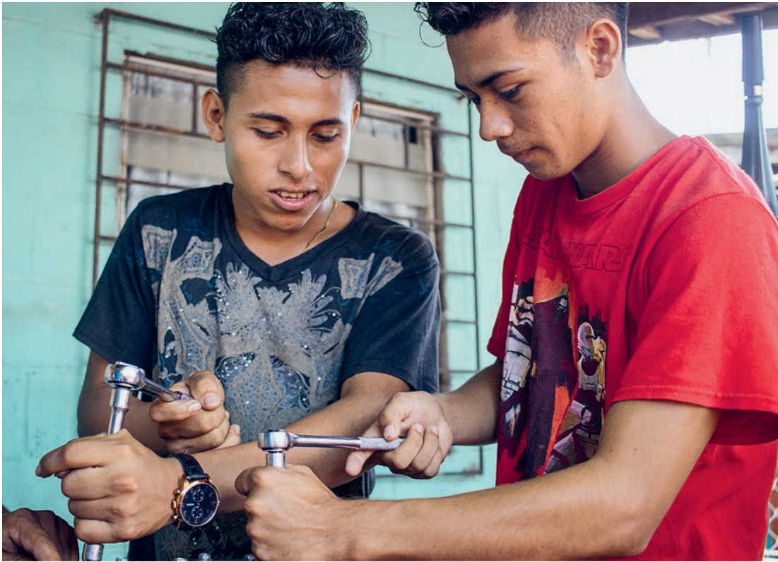
Zwei salvadorianische Jugendliche in der Mechanikerausbildung.

spezifische Gewalt, die insbesondere in Lateinamerika alarmierend hoch ist, schränkt ihre Möglichkeiten ein. Und Gewalt durch Jugendbanden ist für viele Jugendliche in Zentralamerika so bestimmend, dass sie eine Ausbildung und den Einstieg in eine Erwerbsarbeit verunmöglichen kann.