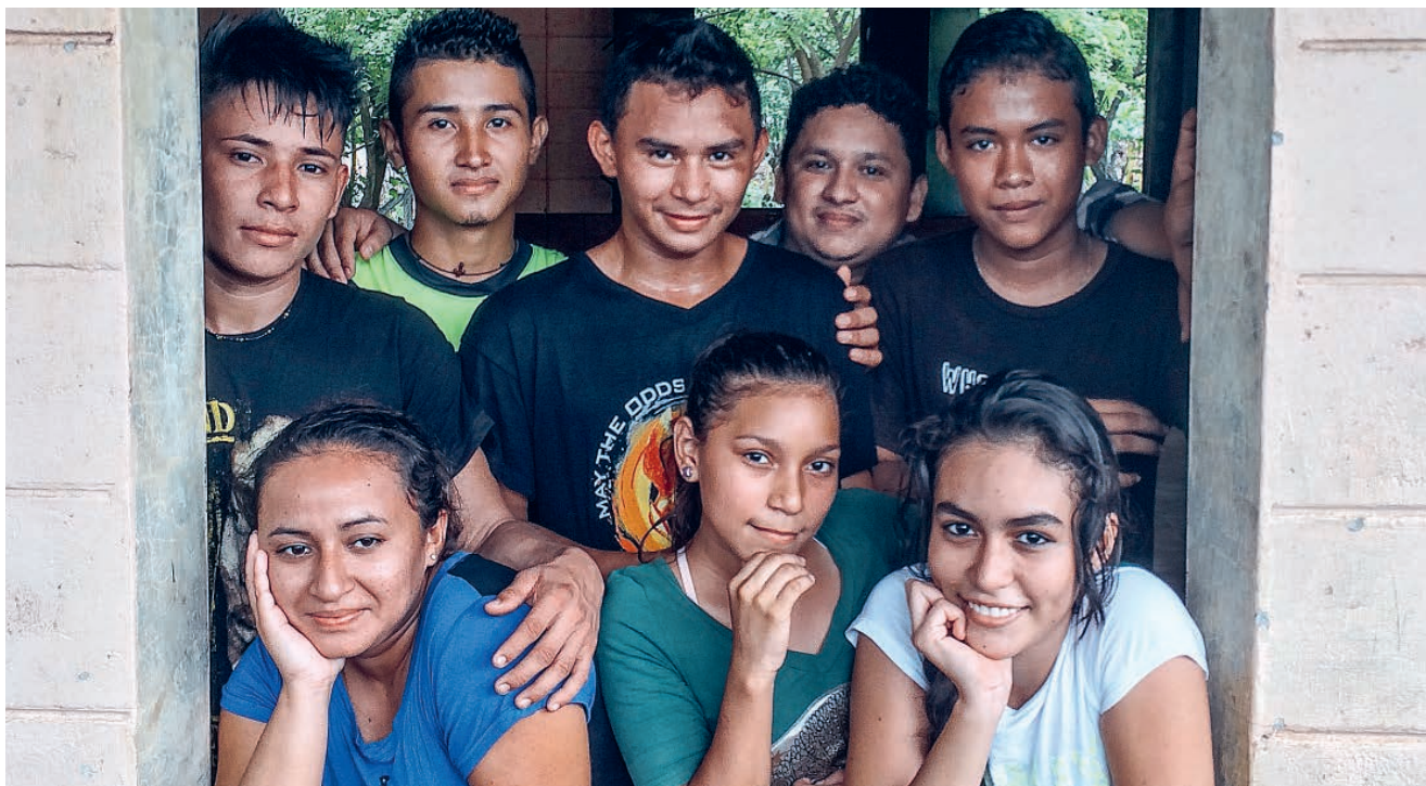
Jugendliche in El Salvador schauen dank Lehrgängen und Starthilfen zuversichtlicher in die Zukunft.

Text: Katja Schurter, verantwortliche Redaktorin der Solidarität, Foto: Solidar Suisse