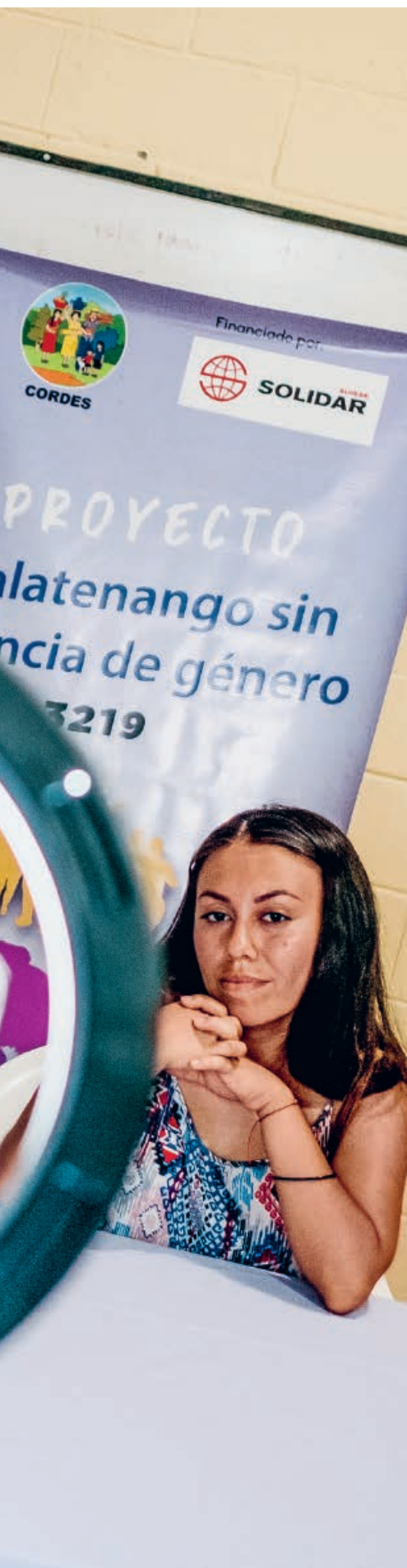
Die Solidar-Partnerorganisation Cordes trägt in El Salvador zur Prävention von Gewalt an Frauen bei.

Solidar Suisse arbeitet weltweit mit zahlreichen Partner*innen zusammen: Stiftungen, lokale Organisationen, überregionale Netzwerke, Institutionen. Wie sieht unser Partnerschaftsansatz aus und was bedeutet er konkret bei humanitären Einsätzen und in der internationalen Zusammenarbeit? Wer trifft in solchen Partnerschaften welche Entscheidungen? Was braucht es für eine Zusammenarbeit auf Augenhöhe? Und wie sehen unsere Partner*innen eigentlich Solidar?