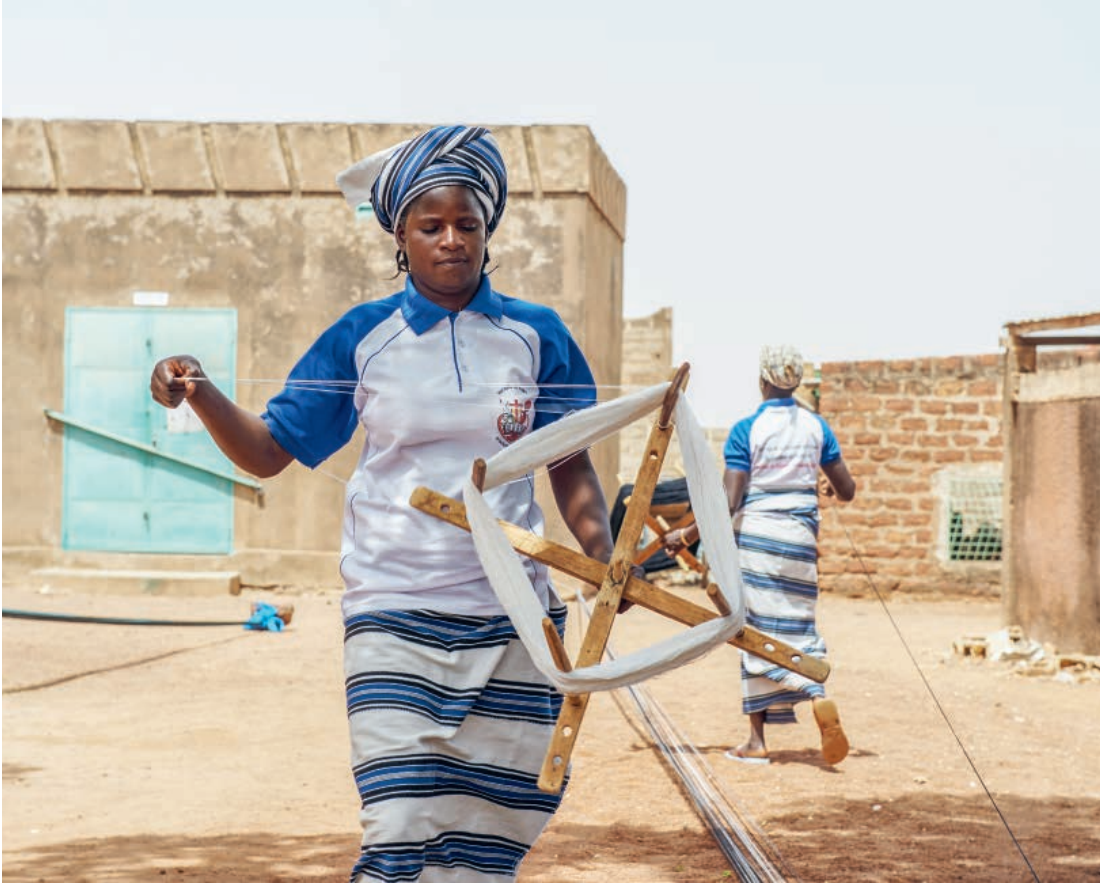
Eine Frau in Burkina Faso wickelt den Baumwollfaden auf, mit dem sie Tücher webt.

Text: Gina Bucher, Redaktorin