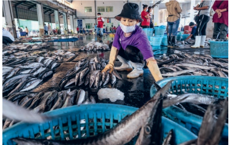
Eine Wanderarbeiterin in Ranong in Thailands Süden beim Verkauf von Fisch.

Dank der Unterstützung von Partnern wie Solidar ist unser Netzwerk gewachsen und zu einem Knotenpunkt migrationsbezogener Entwicklungen in der Region geworden. Informationen fließen hier zusammen, und es entstehen gemeinsame Forschungsprojekte. So können wir überregional politischen Druck zum Schutz der Arbeitsmigrant*innen ausüben: etwa mit der Legalisierung von Wanderarbeiter*innen, einer Reihe bahnbrechender Siege in Fällen von Unterbezahlung und mit der Aufnahme von mehr