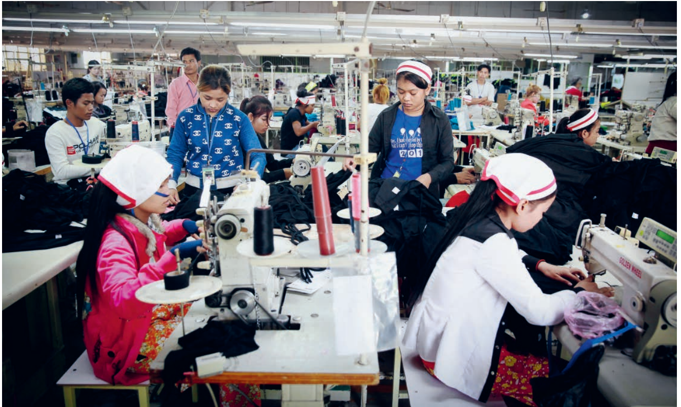
In kambodschanischen Textilfabriken arbeiten vor allem junge Frauen.

Text: Anja Ibkendanz, Leiterin Regionalprogramm Asien, Fotos: ILO und Solidar Suisse