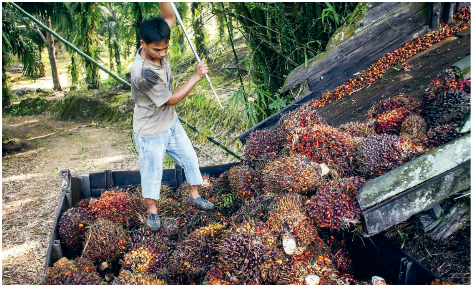
Arbeiter auf einer Palmölplantage im malaysischen Sabah bei der Ernte der Früchte.

duzentinnen, Händlern, Markenunternehmen, Retailern, Banken und Investorinnen. Gewerkschaften oder direkte Arbeitnehmendenvertretungen fehlen gänzlich. Und der RSPO greift wie die meisten Labels vor allem auf Audits zurück. Doch diese können das systematische Machtungleichgewicht in den globalen Wertschöpfungsketten nicht lösen. Deshalb unterstützt Solidar Suisse in afrikanischen und asiatischen Ländern die Arbeiter*innen dabei, sich für würdige Arbeitsbedingungen zu organisieren (siehe Artikel auf den Seiten 8, 10 und 12).