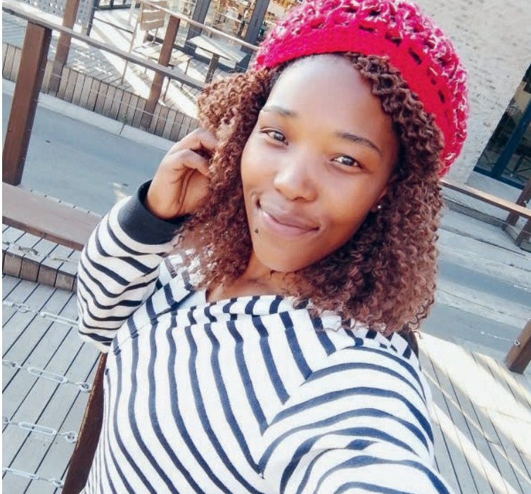
Sthembile Ntshangase kämpft für garantierte Arbeitsstunden bei Ferrero.

Text: Dennis Webster, südafrikanischer Journalist