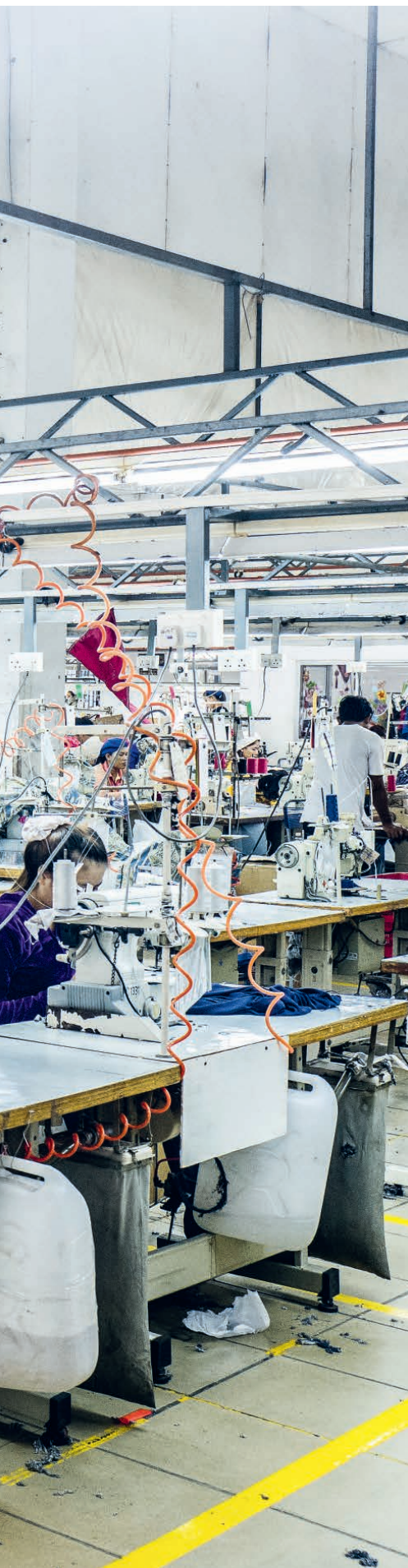
Arbeiter*innen in einer Textilfabrik in Kambodscha nähen Kleider für den Export – zum Beispiel in die Schweiz.

Globale Wertschöpfungsketten sind von enormen Machtunterschieden geprägt. Am oberen Ende stehen die Unternehmen aus reichen Ländern, am untersten die Arbeiter*innen aus Niedriglohnländern, die von Überstunden, schlechten Löhnen und mangelndem Arbeitsschutz betroffen sind. Solidar Suisse engagiert sich für eine Verbesserung ihrer Arbeitsbedingungen.