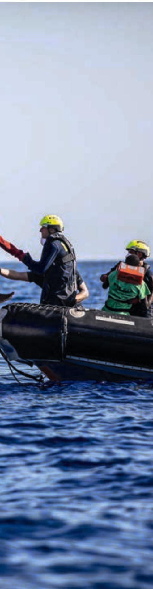
Die SOS Humanity bei der Rettung von Geflüchteten in Seenot auf dem Mittelmeer.

Immer mehr Menschen flüchten – unter grossen Gefahren und mit ungewissem Ausgang: im eigenen Land, über die nächste Grenze, oder sie nehmen monatelange Reisen in andere Kontinente auf sich. Solidar Suisse bietet ihnen Schutz und unterstützt die Aufnahmegesellschaften, um ein würdiges und friedliches Zusammenleben zu ermöglichen.