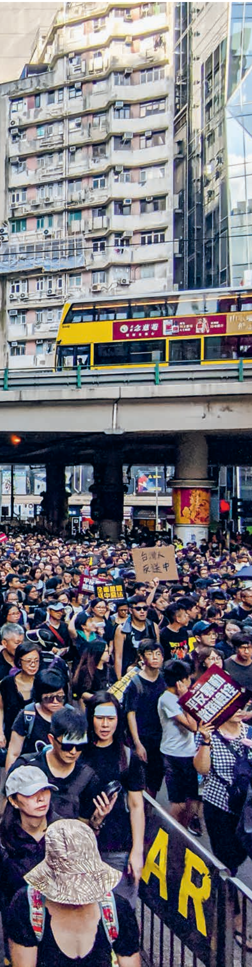
Hong Kong : manifestation contre le projet de loi sur les extraditions vers la Chine en juillet 2019.

L'érosion de la marge de manœuvre de la société civile va croissant – avec de graves conséquences mondiales sur la démocratie et la justice.