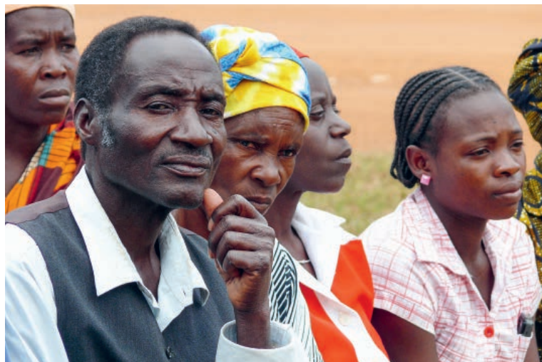
Des villageois-es mozambicain-e-s discutent de leurs besoins les plus urgents lors d'une assemblée.

Texte : Jorge Lampião, ancien responsable du bureau de coordination de Solidar au Mozambique.