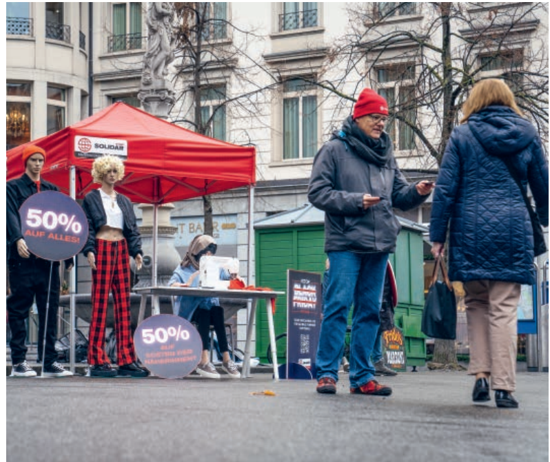
À Lausanne et Zürich, nous avons distribué aux passant·e·s des flyers pour appeler à mettre un terme au Black Friday.

Nous avons bénéficié du soutien non seulement de la population, mais aussi du réseau du parti socialiste. Carlo Sommaruga et Tamara Funiciello ont défendu la cause aux côtés de Cédric Wermuth et Mattea Meyer, de même que le PS genevois. Un