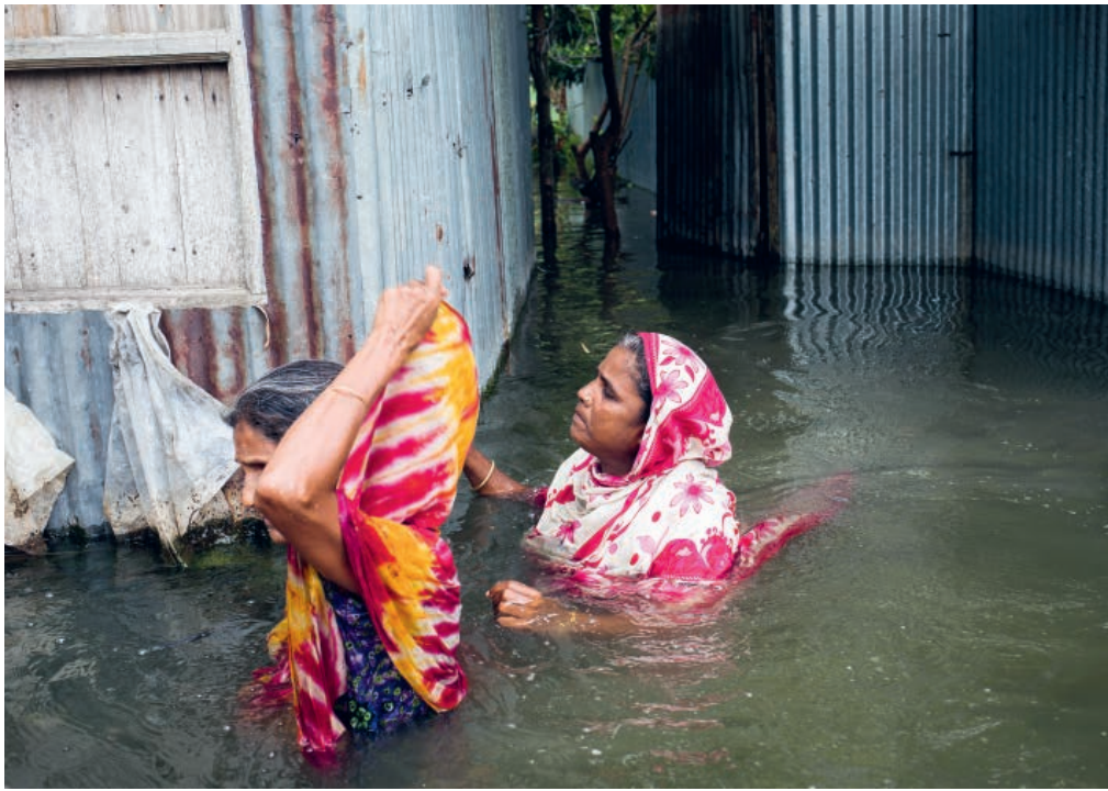
Deux femmes au Bangladesh pataugent dans l'eau pour quitter leurs maisons touchées par les graves inondations de juin 2020.

les travailleur-euse-s sont tôt ou tard contraint-e-s de migrer. Certain-e-s perdent leur travail ou leur logement en raison des catastrophes naturelles passées ou imminentes. Selon la Banque mondiale, dans les seuls États côtiers comme le Bangladesh, l'Inde, le Pakistan et le Sri Lanka, plus de 700 millions de personnes, soit près de la moitié de la population d'Asie du Sud, ont été frappées par au moins une catastrophe climatique au cours de la dernière décennie.