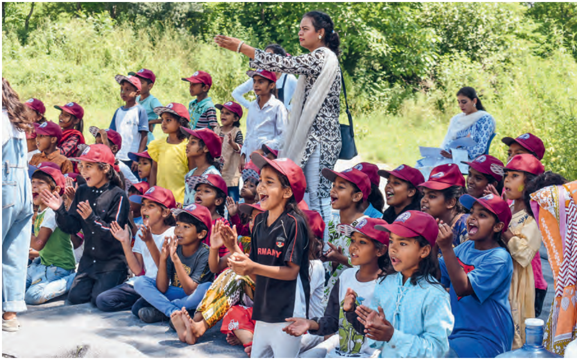
Des enfants encouragent leurs camarades lors d'un événement sportif de l'école de la communauté.