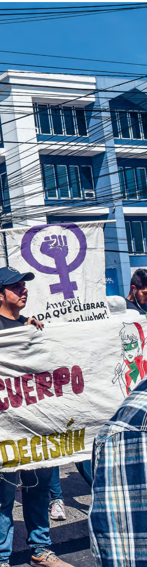
Au Salvador, lors de la Journée internationale des droits des femmes, le 8 mars, des femmes manifestent pour leurs droits.

Selon le World Inequality Report, entre 1995 et 2021, les 1 % les plus riches ont capté 38 % de la nouvelle richesse, alors que les 50 % les plus pauvres n'ont bénéficié que d'un maigre 2 %. Comment l'augmentation des inégalités est-elle liée à la discrimination ? Comment l'exclusion affecte-t-elle les possibilités de formation, les conditions de travail et les perspectives ? Comment pouvons-nous y remédier ?