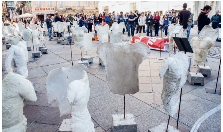
Inauguration de l'exposition « 100 morts de l'amiante » le 28 avril 2010 sur la Piazza Riforma à Lugano.

La création d'un fonds d'indemnisation des victimes en 2017 a permis, certes avec retard, une avancée significative. Le soutien et l'indemnisation ne sont malgré tout que partiellement résolus. Pour les employé-e-s qui ont été en contact avec la fibre sur leur lieu de travail, la loi sur l'assurance-accidents LAA concernant les prestations pour les maladies professionnelles est applicable. Il se peut toutefois que le contact ait été indirect, comme les épouses qui ont lavé à la maison les vêtements contaminés de leur mari. Celles-ci ne touchent aucune prestation de la LAA, qui sont meilleures. La question de la prescription des prétentions juridiques n'est pas non plus résolue. En outre, les travailleur-euse-s atteint-e-s ne