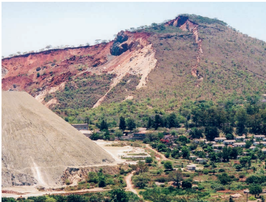
Mine d'amiante à Mashaba au Zimbabwe.

enfreintes, s'indigne-t-elle. Il serait tout à fait possible d'utiliser d'autres matériaux. » Crecentia Mofokeng demande l'application des interdictions nationales et l'inclusion de l'amiante dans la Convention de Rotterdam (voir page 5), ce qui rendrait nécessaire le consentement éclairé et reviendrait de fait à une interdiction universelle. Reste à savoir comment démanteler l'amiante en toute sécurité : « Comment éviter la pollution de l'air et le risque pour les personnes ? » Un problème qui n'a pas non plus trouvé de solution en Suisse.