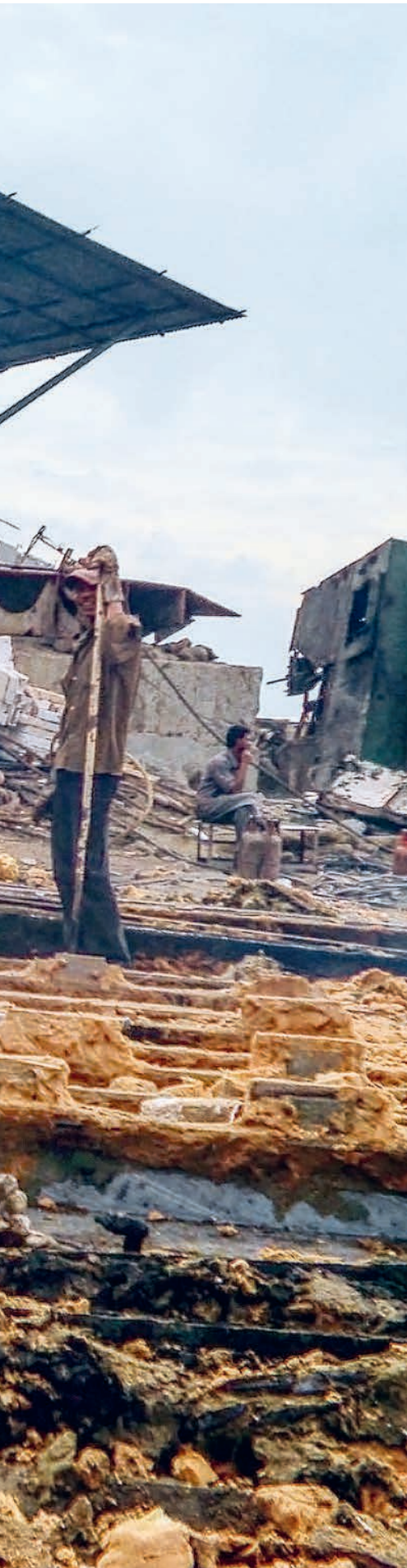
Dans les cimetières de navires de Chittagong, au Bangladesh, les travailleur-euse-s sont souvent exposé-e-s à l'amiante sans équipement de protection.

Interdit en Europe depuis des décennies, l'amiante est très répandu en Afrique et en Asie, avec des suites fatales. Les pays producteurs s'opposent sans scrupule à son interdiction, pourtant urgente.