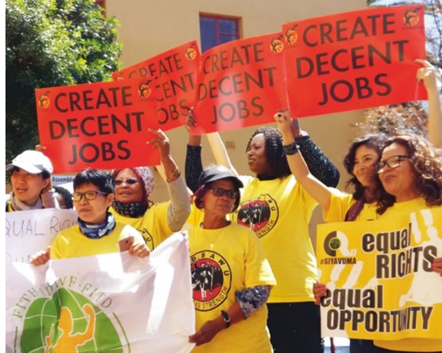
Sadsawu demande des conditions de travail dignes pour les travailleur·euse·s domestiques lors d'une action au Cap.

Les travailleur·euse·s informel·le·s et temporaires ne sont souvent pas autorisé·e·s à se syndiquer. Elles