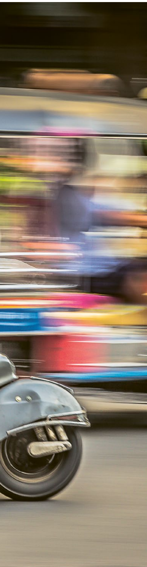
Coursier en moto à Bangkok.

Un nombre croissant de personnes travaillent sans emploi fixe dans le monde. La sécurité sociale recule tandis que les gouvernements répressifs limitent toujours davantage la marge de manœuvre des syndicats. De nouvelles formes d'organisation sont nécessaires, défis lancés aux syndicats et innovations du côté des travailleur·euse·s.