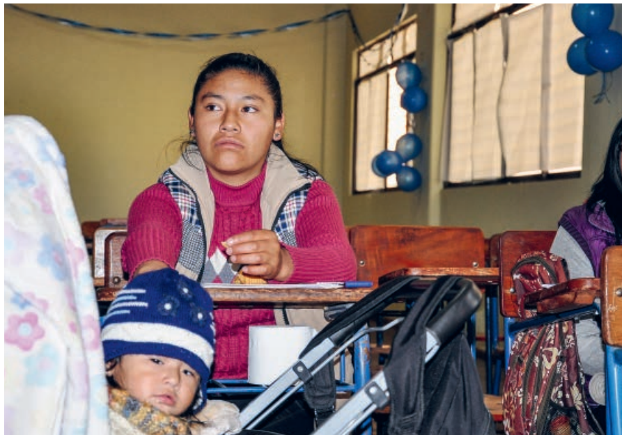
Une jeune mère poursuit ses études.

Texte : Joachim Merz, responsable du programme Bolivie, photo : Solidar Suisse