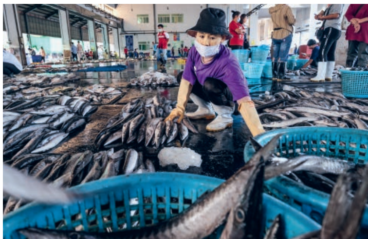
Une travailleuse migrante de Ranong, dans le sud de la Thaïlande, en train de vendre du poisson.

Avec le soutien de partenaires comme Solidar, notre réseau s'est élargi pour devenir l'un des centres névralgiques des développements liés à la migration dans la région. Les informations sont rassemblées et des projets de recherche communs lancés ici. Nous pouvons ainsi exercer une pression politique au niveau transrégional pour protéger les travailleur·euse·s migrant·e·s, que ce soit à travers leur régularisation ou une série de victoires historiques dans des cas de rémunération insuffisante ou encore en intégrant davantage de personnes migrantes dans le système de sécurité sociale. Malgré